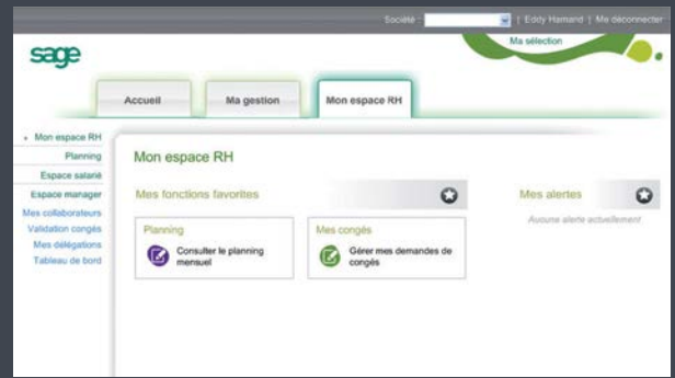
Page d'accueil de Sage Intranet RH